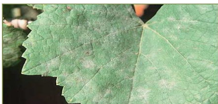
Oídio na folha e no caho

Se, em alternativa, e o estado do tempo o permitir, utilizar enxofre em pó, procure não fazer este tratamento com temperaturas elevadas – acima dos 32º C - e a planta molhada, para evitar riscos de fitotoxicidade – (queima).