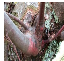
Cancro no tronco e pernada de castanheiro