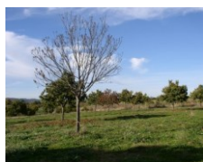
Castanheiro morto pelo fungo e tinta na base do tronco, em forma de cunha

É uma doença muito grave do sistema radicular, que leva à morte dos castanheiros. Não existe um tratamento químico eficaz, devendo a luta contra esta doença ser essencialmente preventiva.