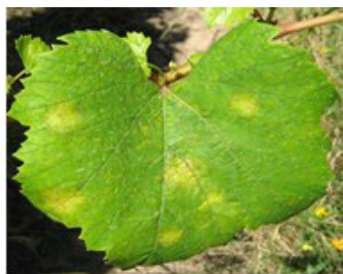
Manchas de míldio na folha da videira

As condições climáticas que se fizeram sentir em toda a região, criaram condições favoráveis à formação de novas infecções de míldio, nas vinhas da região.